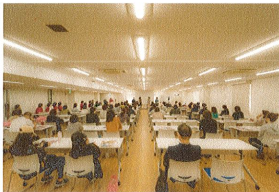
プレスト・アウェアネスセミナー