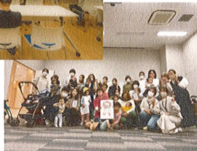
子育てサロン出展