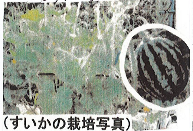
(すいかの栽培写真)