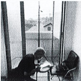
社協と市内小学校間の 電波状況の確認 "その時"に備えて電波の 伝搬状況を予め確認 スムーズな避難所運営を 目指しています