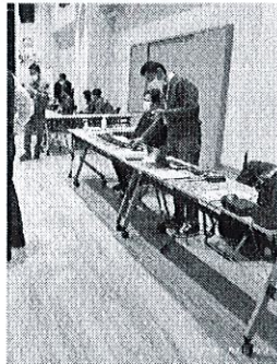
あまおだ減災フェス 出展協力 無線機メーカーの協力で 来場者は無線機の有用性 の体験をされました