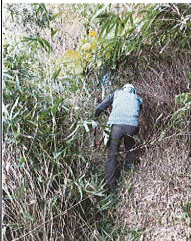
作業道の位置確認