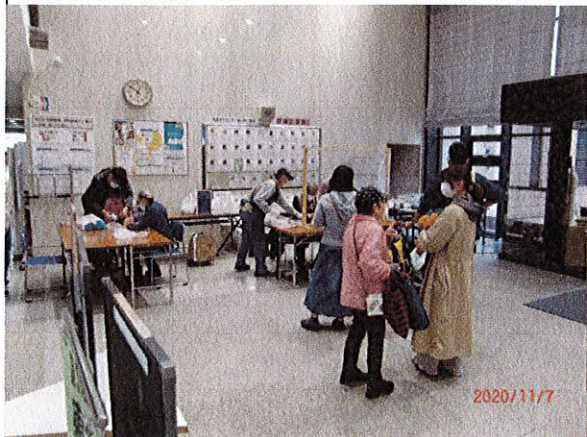
コープカルチャー生活文化センター