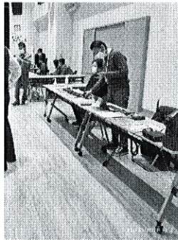
あまおだ減災フェス 出展協力

"その時"に備えて電波の 伝搬状況を予め確認 スムーズな避難所運営を 目指しています