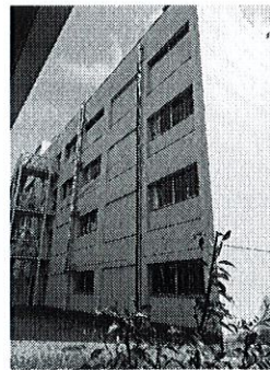
伊丹市立天王寺川中学校 トライやるウィークの 後方支援