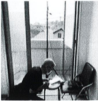
社協と市内小学校間の 電波状況の確認

"その時"に備えて電波の 伝搬状況を予め確認 スムーズな避難所運営を 目指しています