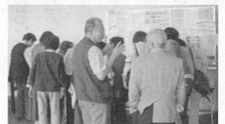
ネットワーク作りに役立った情報コーナー

は、今後の活動のヒントを得て元気な気持ちになっていただけました。 2011年度も賛助会員や寄付者、そして、財団の主旨を理解し、活動されているすべてのボランティアのみなさんと共に、私たちも課題解決のため、頑張っていきたいと思えます。本年度も、どうぞよろしくお願いたします。