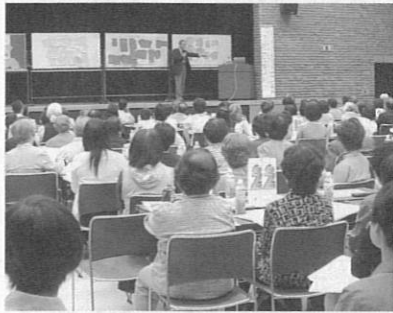
参加者の意見を紹介しながらの講演会

コープともしびボランティア振興財団 「2011年度助成金・市民活動交流会」を開催