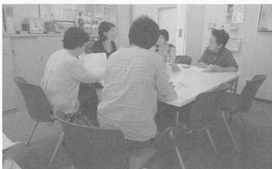
事務所での個別相談の様子