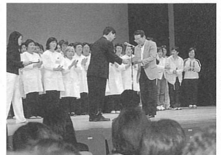
奨励賞を受け取る「アンサンプルフレンズ」のみなさん

受賞されたグループからは、「思いがけなく奨励賞をいただき、自分たちの活動が認められたことへの感謝と喜びに溢れています」「受賞を目指したものの、わたしたちの思いを伝えることができたことに満足感いっぱいです」「これまでの財団による支援への感謝の念と、活動報告を伝えたくて出場しました」「他団体の活気あふれるプレゼンテーションに大変励まされ、刺激を受けました」などの声をいただきました。