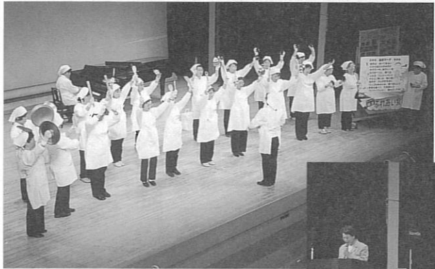
「コープデイズ相生ふれあい食事の会」の工夫と迫力あふれるプレゼンテーション