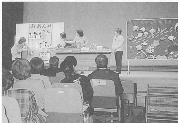
「かめのごグループ」の工夫をこらした活動内容に魅せられました