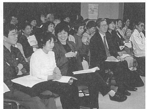
思わず引き込まれ、熱心にきき取る参加者のみなさん