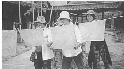
自分たちで早朝刈り取った草木を使い、染めを体験