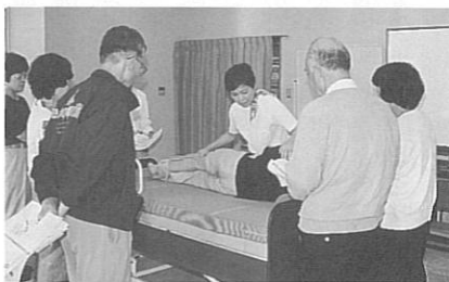
在宅介護の基本を学びました

毎年、好評のボランティア講座「生きがい見つけませんか」。今年度は、10月の土曜日(キャンのみ土・日)に4回シリーズで、それぞれテーマ、講師を変えてのバラエティーに富んだ内容で開催しました。