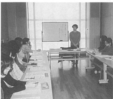
熱心に「子育て支援」の講義に耳を傾ける参加者たち