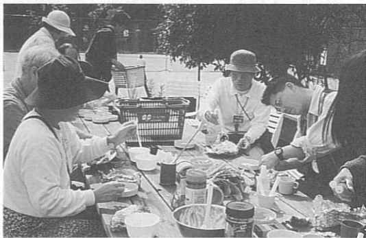
ワイワイガヤガヤと楽しく野外で食事

10月14日(土)〜15日(日)、秋の澄み切った空気に包まれて、「コープふるさと村やちよ」で、シニアキャンプを行いました。